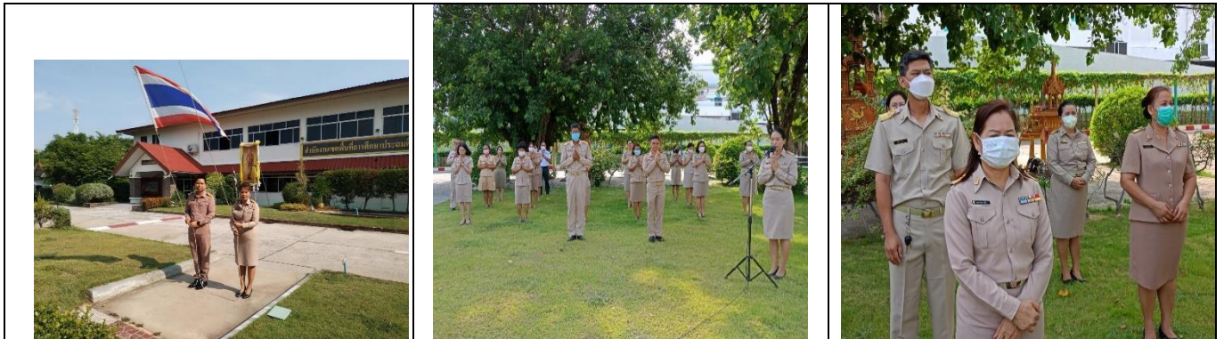
กิจกรรมเข้าแถวเคารพธงชาติ สวดมนต์ไหว้พระ กล่าวคำปฏิญาณเขตสุจริต และผู้บริหารพบบุคลากร เจ้าหน้าที่