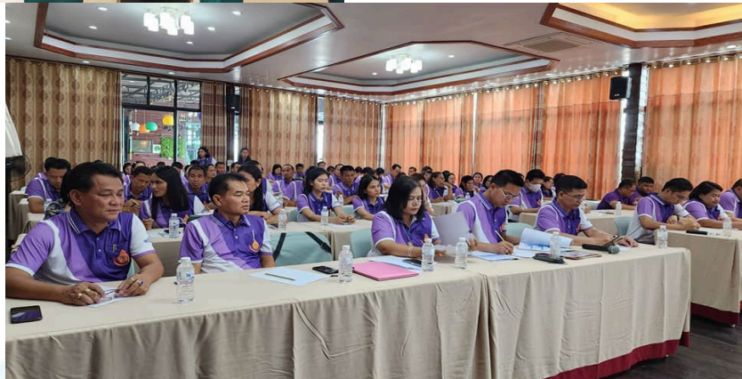
กลุ่มบริหารงานบุคคล สำนักงานเขตพื้นที่การศึกษาประถมศึกษาสุรินทร์ เขต ๓